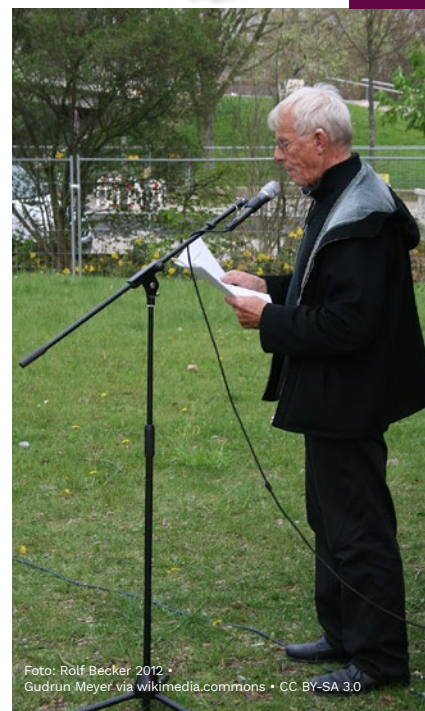
Foto: Rolf Becker 2012 • Gudrun Meyer via wikimedia commons • CC BY-SA 3.0

Auf der Trauerfeier in der Hamburger Dreieinigkeitskirche kommen Freunde, Genossen, Kollegen und Gewerkschafter zu Wort. Und der Verstorbene selbst lässt der anwesenden Ratsvorsitzenden der EKD durch die Pastorin mitteilen, dass er die neue Denkschrift der evangelischen Kirche, mit der Militärdienst, Atomwaffenbesitz und Erstschlagsdrohung als neue Wehrtüchtigkeit propagiert werden, scharf ablehne. Dafür gibt es großen Beifall. Dem letz-