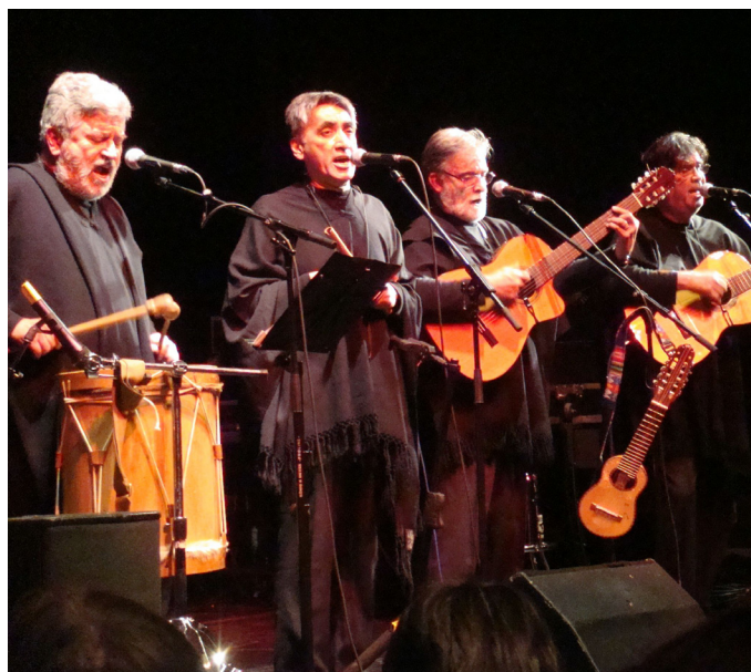
Quilapayún aus Chile, zu deren Gründungsmitgliedern Victor Jara gehörte, singen in der Volksbühne Berlin auf der Veranstaltung der LINKEN gegen Bankenmacht

Erstmals 2011 fand nach der Ehrung für Rosa Luxemburg und Karl Liebknecht ein „Europäischer Kulturtreff“ statt – schnell organisiert im Kino KOSMOS. Es war ein voller Erfolg – nur der Veranstaltungsraum war viel zu klein. Dem Wunsch nach Wiederholung trug der Veranstalter Rechnung. Im Sinne des Aufrufs von Mikis Theodorakis und Manolis Glezos an die Völker Europas, sich gegen die Diktatur der Finanzmärkte zu wehren, stand die Veranstaltung unter dem Motto „GegenBANKENmacht“. Eingeladen hatten die Partei der Europäischen Linken (EL) und DIE LINKE für den