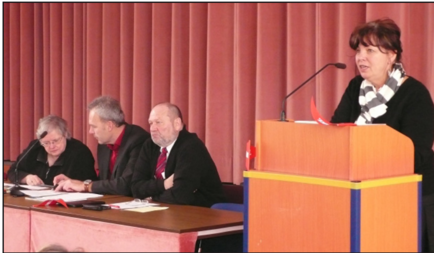
Landrätin Marion Philipp spricht auf der Mitgliederversammlung der LINKEN

Kreisvorstand und Kreisfraktion konzentrierten sich seit Anfang 2011 auf die Landratswahlen. Dabei wurde auch die Möglichkeit eines Kandidaten ohne Parteibuch nicht ausgeschlossen. Bei der Suche nach einem geeigneten Kandidaten stellte sich schnell die Frage, welche Ziele der künftige Landratskandidat anstreben sollte.